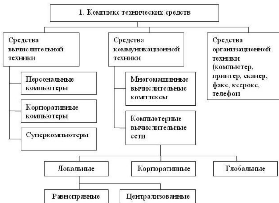
Рисунок 1 - Структура комплекса технических средств АИТ