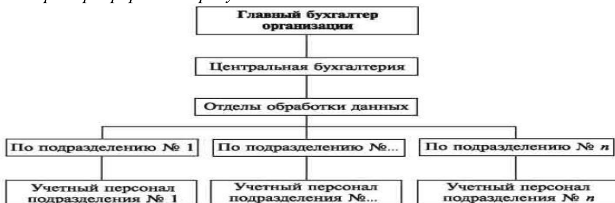
Рисунок 1 – Линейная структура организации бухгалтерской службы предприятия